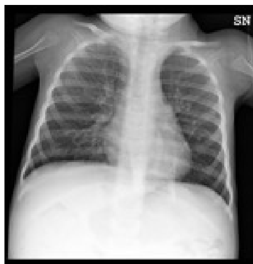
Fig.2. Radiografia dopo 48 ore.

Caso clinico 2- Maschio, 14 anni, affetto da fibrosi cistica e con positività batteriologica dell'espettorato per Pseudomonas aeruginosa veniva ricoverato in Pneumologia per riacutizzazione respiratoria con calo della funzionalità polmonare. La RX del torace evidenziava la presenza di atelettasia medio-basale destra (figura 3). Instaurata idonea terapia medica, sono state utilizzate le seguenti tecniche di fisioterapia respiratoria: